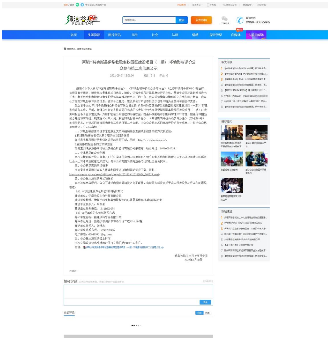
图2 本项目第二次网络公示截图