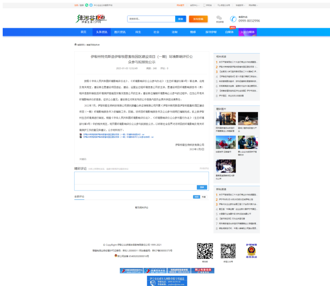
图 6 本项目拟报批稿网络公示截图