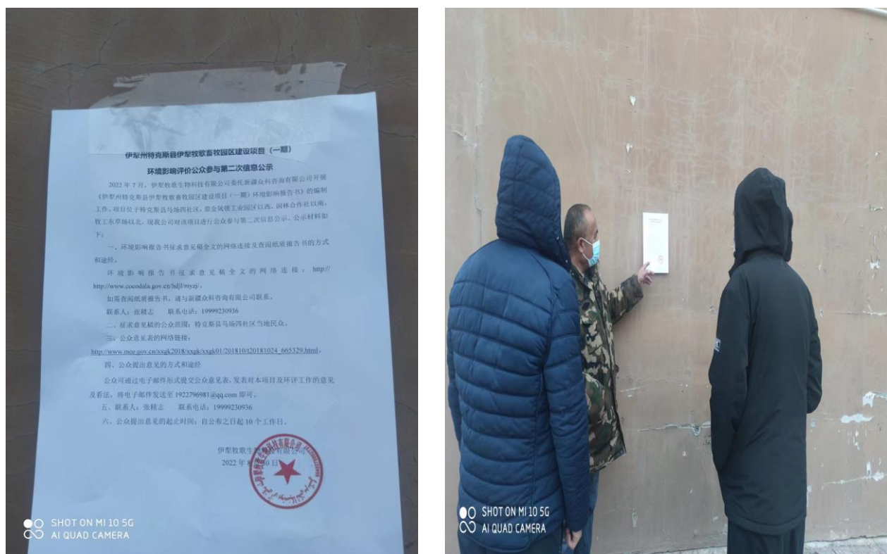
图5 本项目公告公示照片