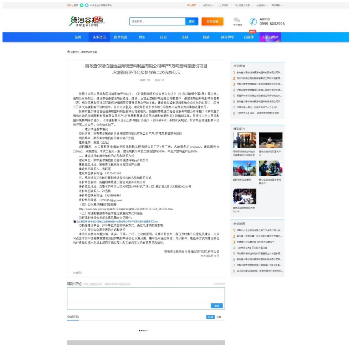
图2 第二次网上公示截图