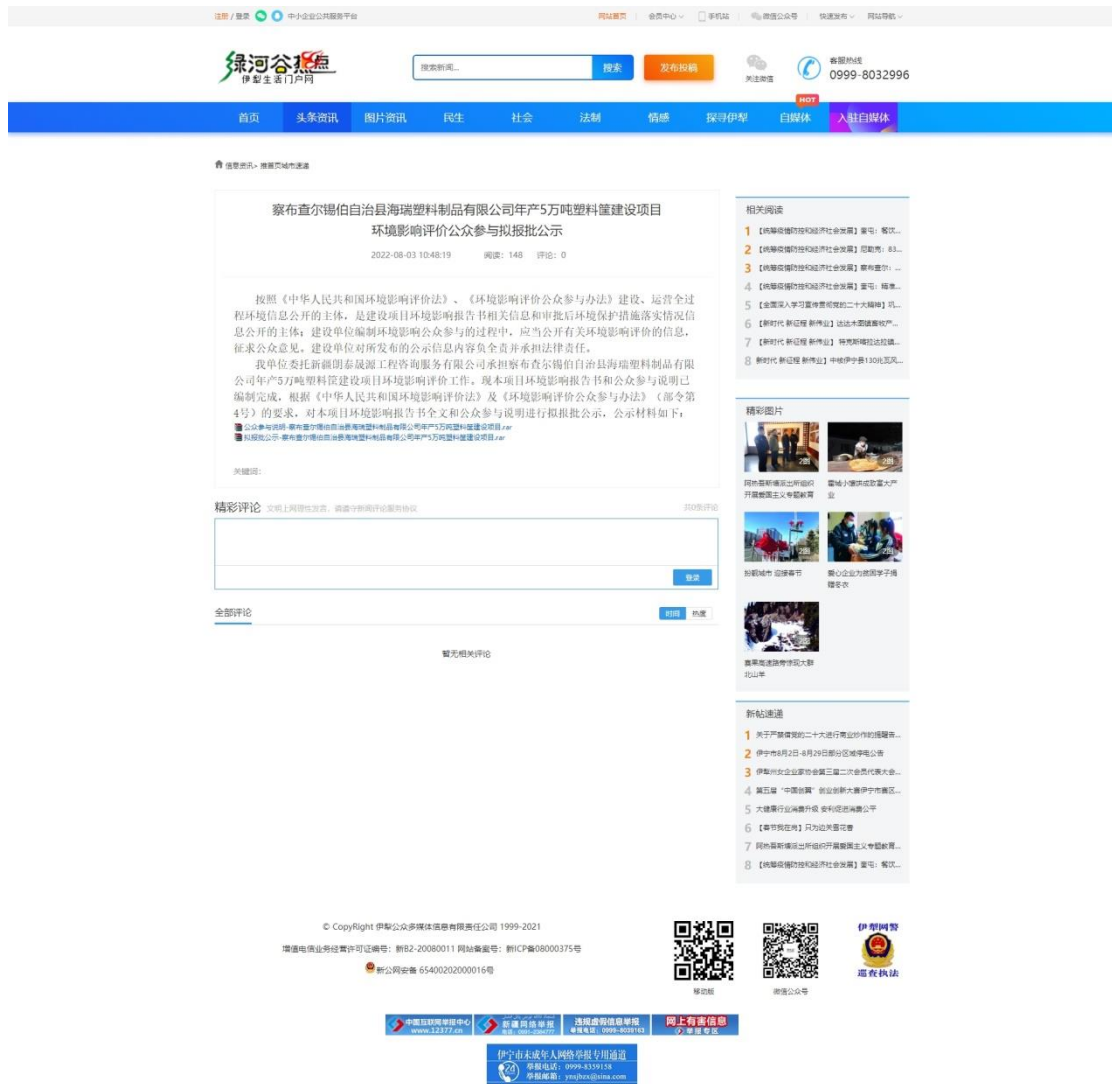
图 6 环境影响评价公众参与拟报批公示截图