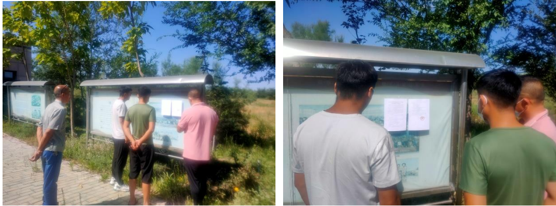
图 5 张贴公示照片