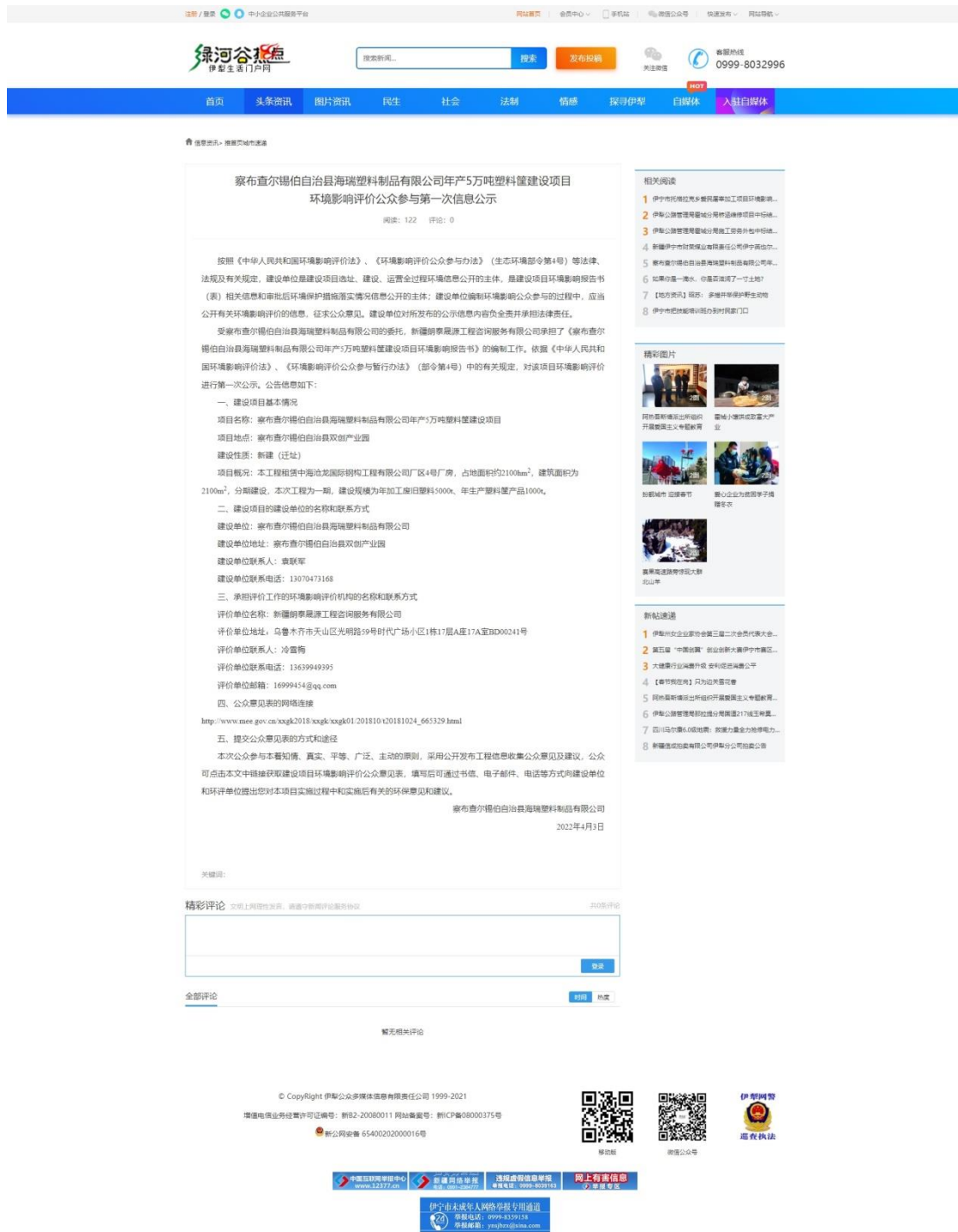
图 1 第一次网上公示截图