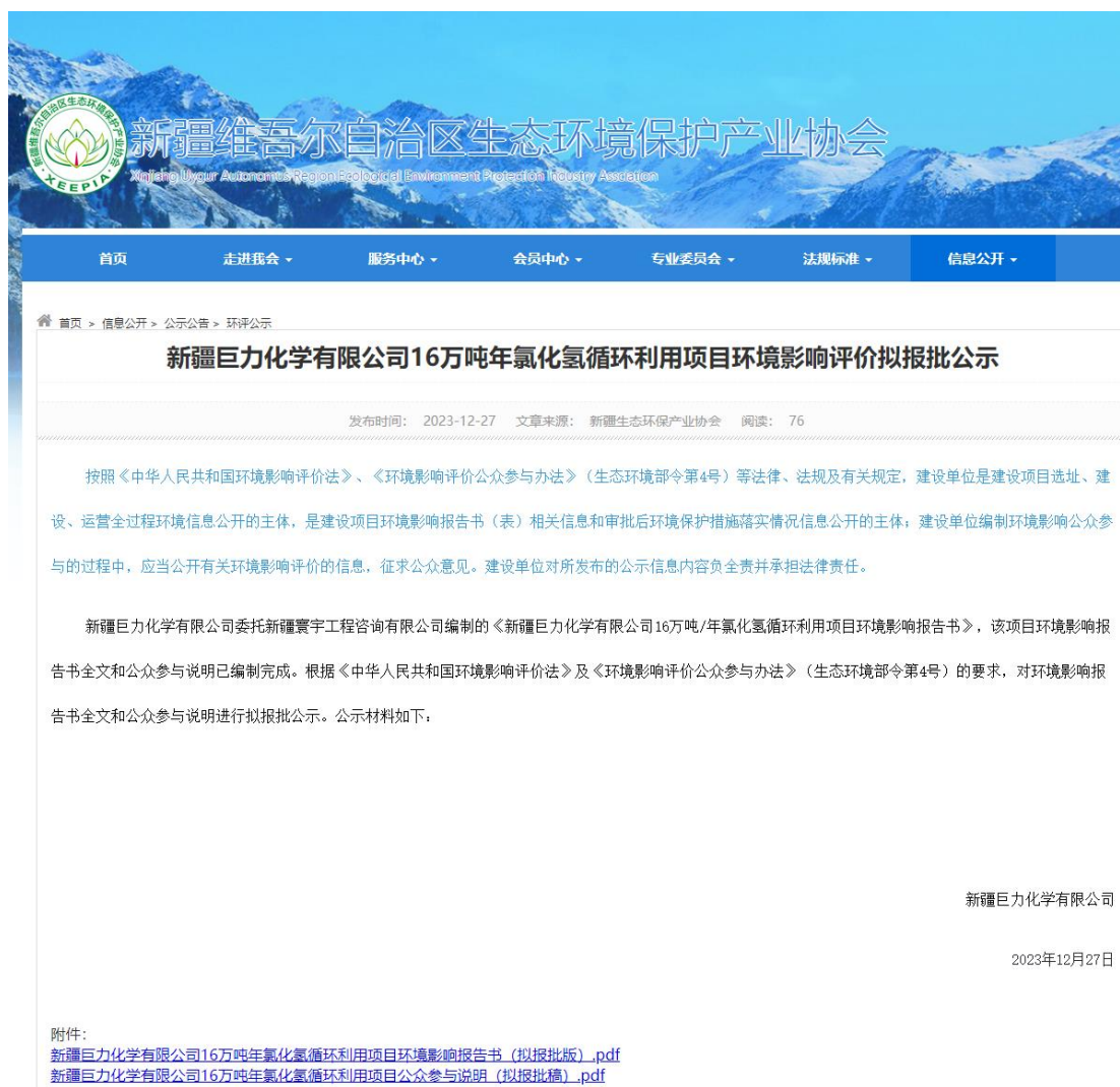
图4 本项目拟报批网络公示截图