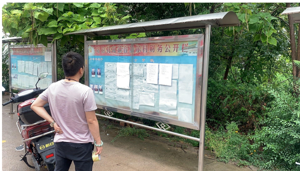
图 3-4 征求意见稿张贴公告公示截图