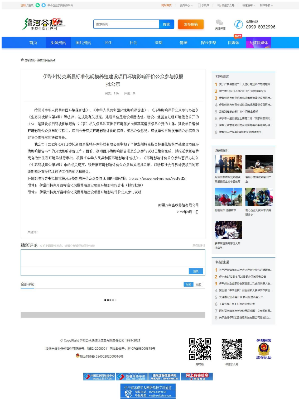
图 6-1 拟报批公示网络截图